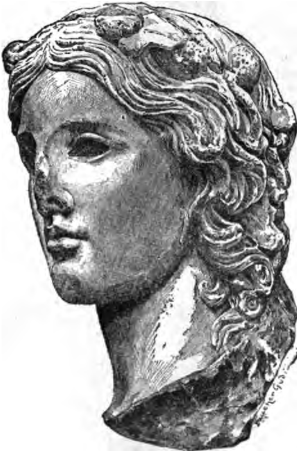
Probe der Abbildungen.

Darstellungen der griechischen Plastik am meisten den Anforderungen der Gegenwart entspricht, am besten über den Stand der Forschung orientirt und sich am besten liest. Wenn C. von der deutschen Forschung einen sehr ausgiebigen Gebrauch macht und ganz vorzugsweise auf deutsche Arbeiten verweist, so kann uns das ja nur freuen; es ist ein Beweis mehr dafür, dass wenigstens auf diesem Gebiete keine nationalen Schranken bestehen, sondern überall gemeinsame Arbeit herrscht . . . Die Ausstattung des Buches ist der Originalausgabe durchaus ebenbürtig, und trotzdem ist, ein seltener Fall, der Preis nicht unerheblich geringer. . . " Literar. Centralblatt 1897 Nr. 44.